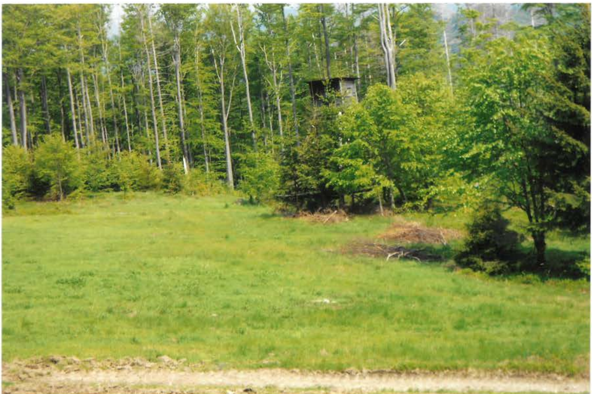
Posed v blízkosti Kocuby 6/2019