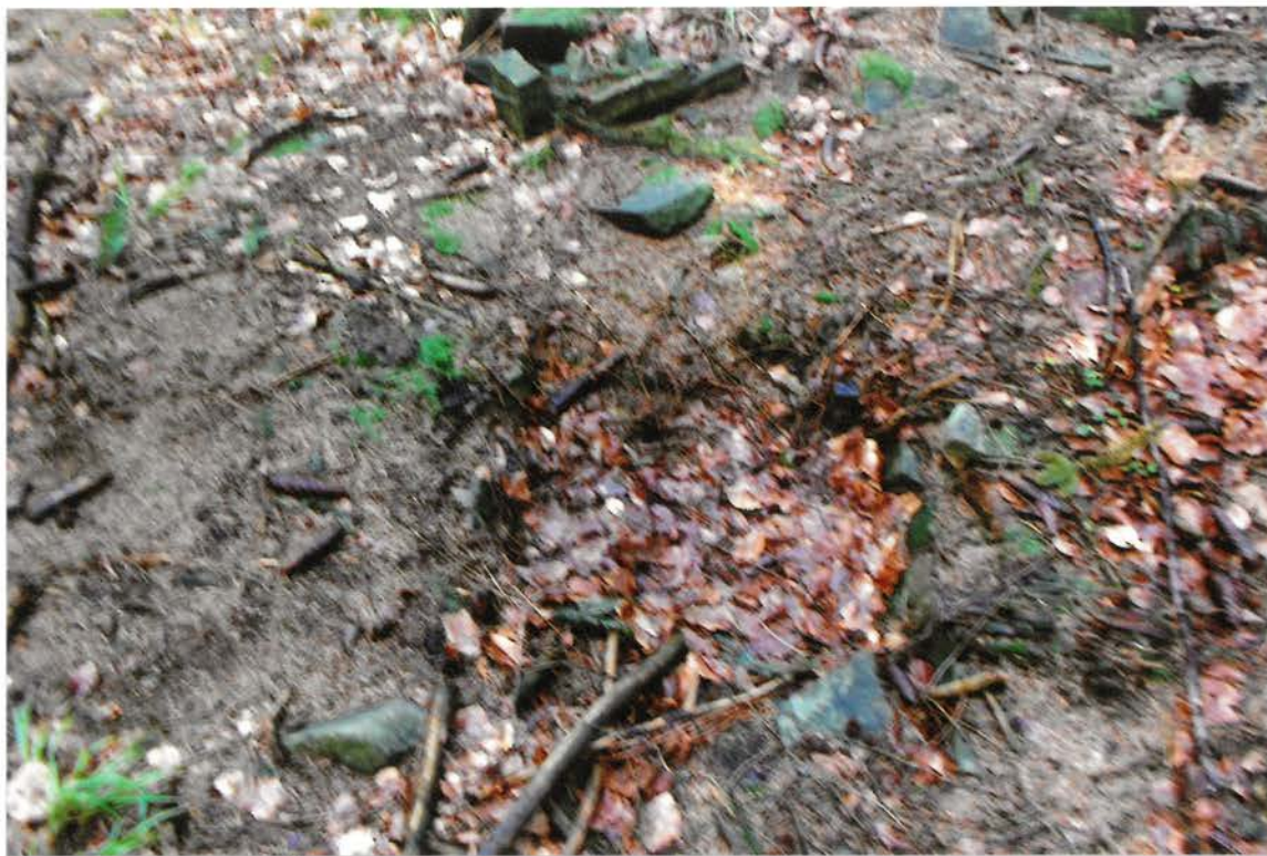
DŮLEK V PROSTORU DOMU