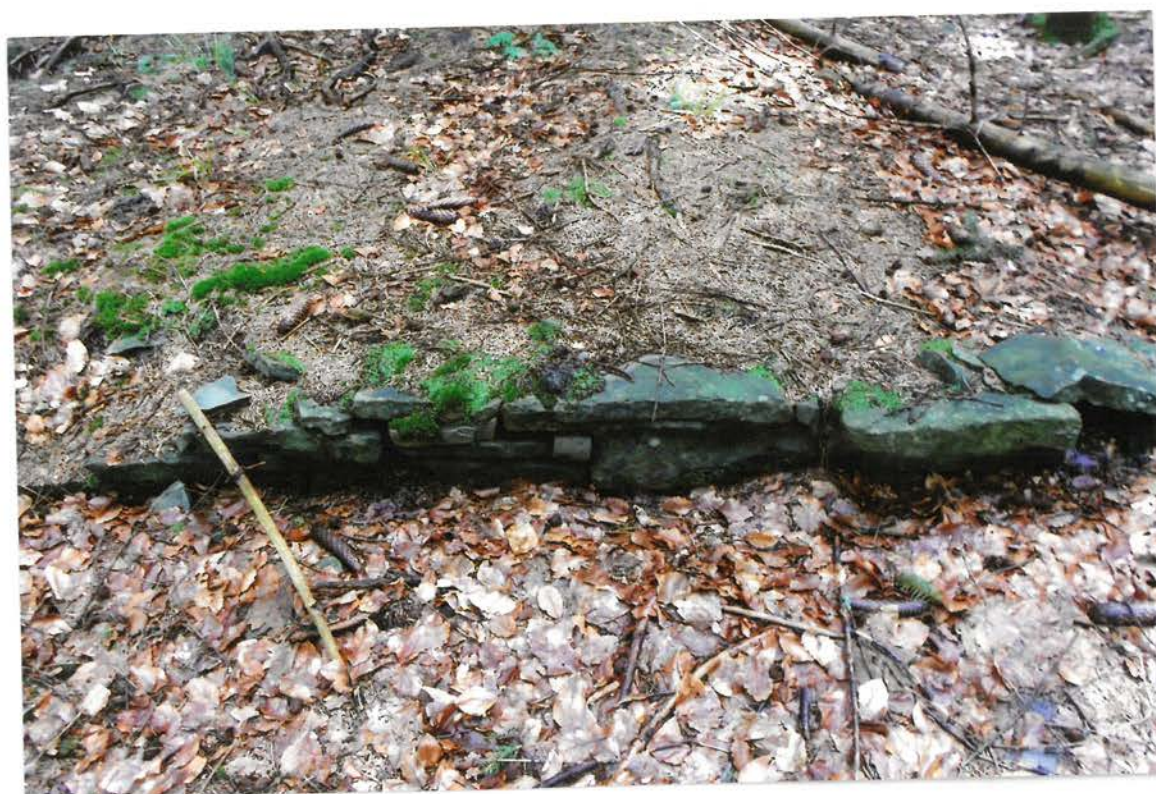
JIŽNÍ ČÁST KAMENNÉHO ZÁKLADU